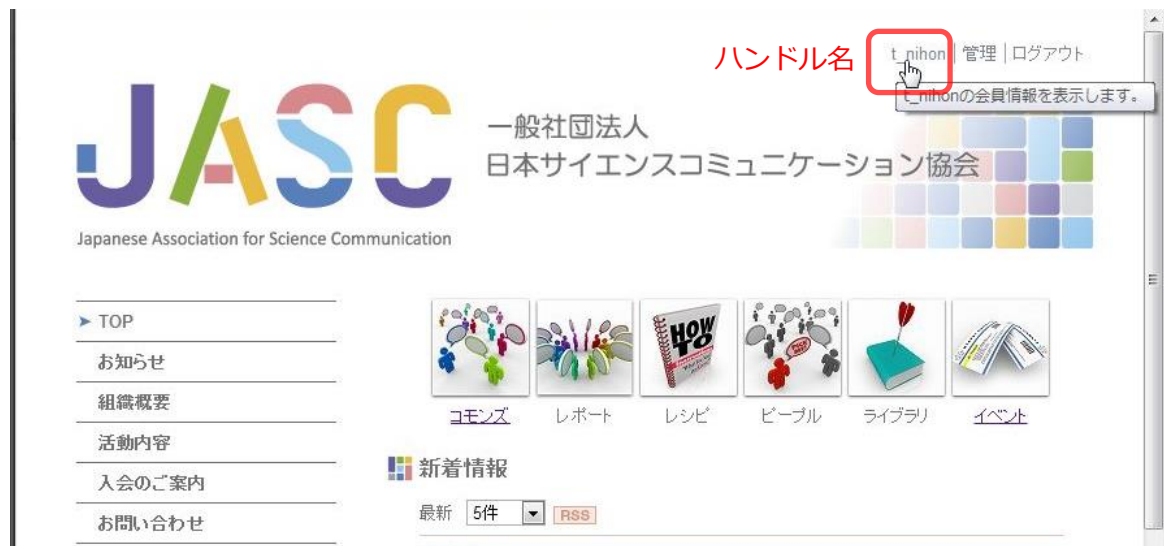
図 3-1 ログイン後のサイト TOP ページ