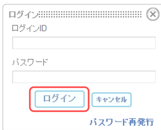
図 2-2 ログイン画面