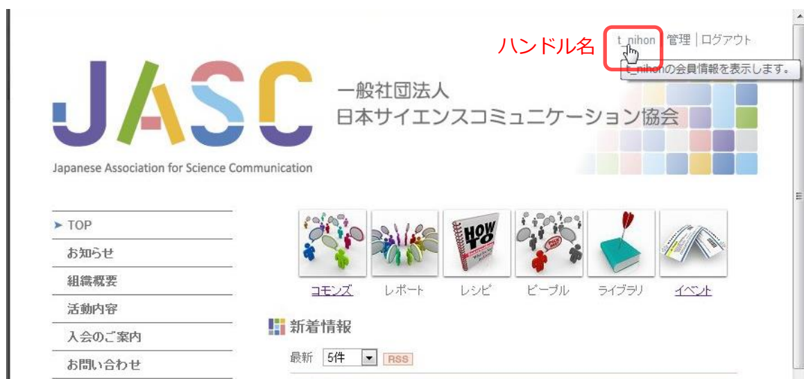
図 2-3 ログイン後のサイト TOP ページ