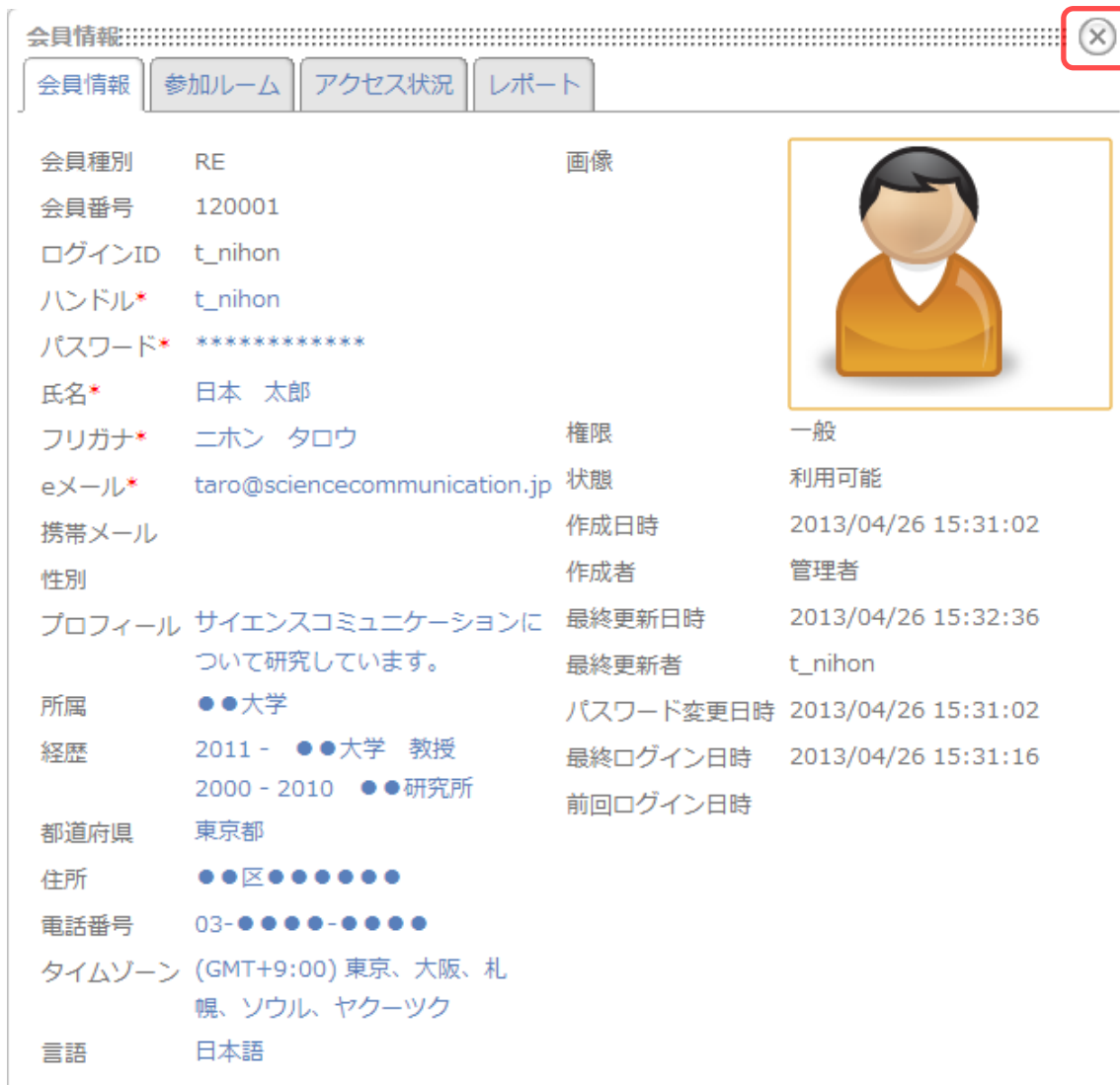
図 3-4 会員情報編集画面（画像設定後）